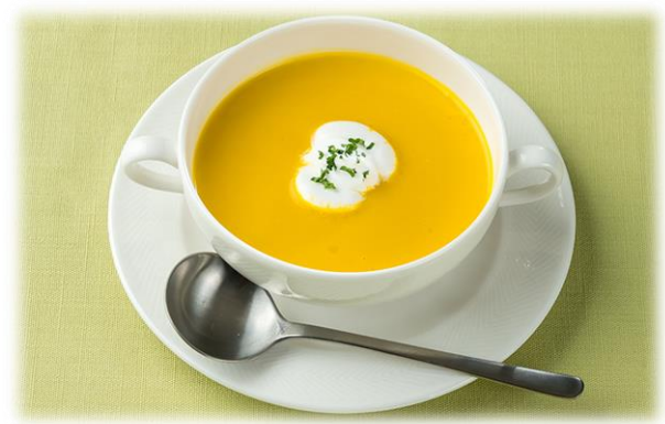
パンプキンスープ

甘みとコクのあるタレが絡む柔らかい豚ロース肉のチャーシューと鶏のうま味が染み込んだご飯が絶品です。辛めのチリソースをつけるとより一層美味しくいただけます。