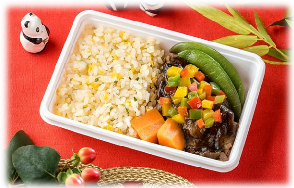
牛肉のブラックビーンソース

羽田空港オリジナルのランチョンマットです。綿100%の帆布生地です。耐久性抜群！洗濯もでき、繰り返し使えるため普段のお食事にもご活用ください。