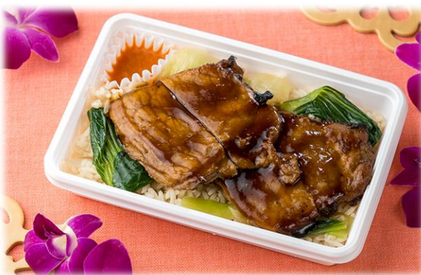
シンガポール焼豚丼 (チャーシューファン)

ロコモコをイメージしたサーモンのアレンジ料理です。スクランブルエッグを散らしたライスの上にサーモンをのせ、たっぷりの椎茸クリームソースとともに召上がりください。食べ応えのある DOMBURI スタイルです。