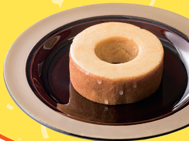
〈The Butter Baum〉 リッチソフトホール 1,850円