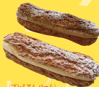
〈プレミアム バーム〉 ザクレア378円