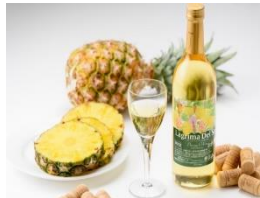
「パインアップルワイン」