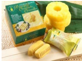
「パインチョコちんすこう」