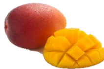
「沖縄県産マンゴー」