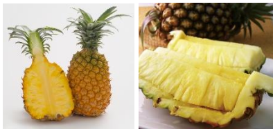
「沖縄県産パインアップル」