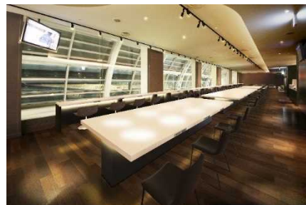
リフレッシュ工事後のイメージ