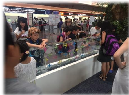
昨年度の実施風景