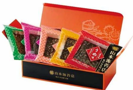
第58回国土交通大臣賞 東京都・(株)山本海苔店 一藻百味 5袋セット