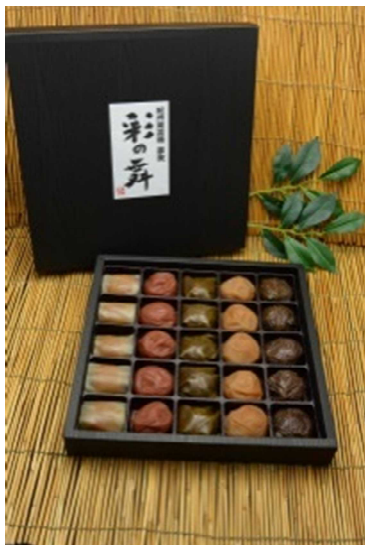
第58回農林水産大臣賞 和歌山県・(株)紀和農園プロダクツ/ 紀州南高梅 夢葵 彩の舞