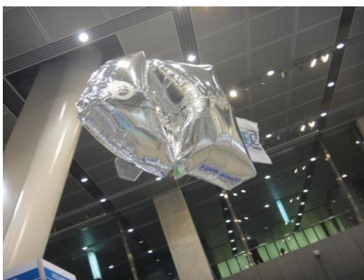
バルーン魚ロボット