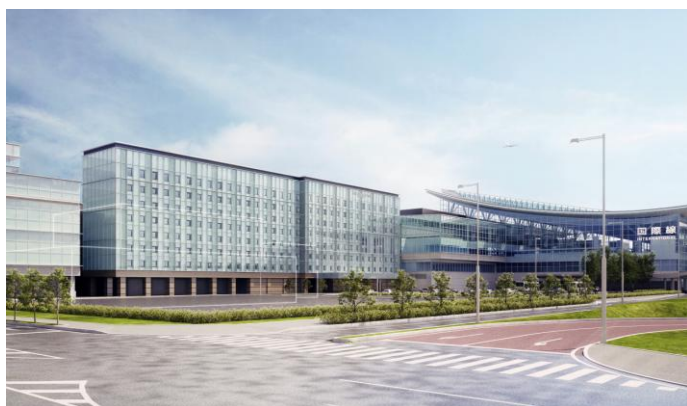
■ホテル棟外観パース

ホテルコンセプトは「夢みる箱」。世界を旅する人々の記憶に残るホテルとして、機能性、快適性はもちろん、随所に遊び心と楽しさを兼ね備えたお洒落なシティホテルとします。また、保安エリア*1に17室の客室、リフレッシュルームなどを有する日本初のトランジットホテル*2として、海外からの乗継のお客様にも快適なくつろぎの時間をご提供いたします。「世界に一番近い日本のホテル」として、高い利便性と機能性と共に、ロイヤルパークホテルズならではの高いホスピタリティを発揮し、日本の「おもてなし」文化の発信拠点を目指します。