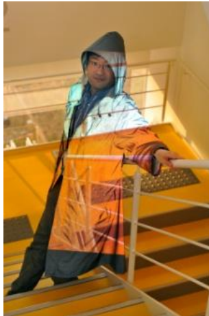
（光学迷彩システム）