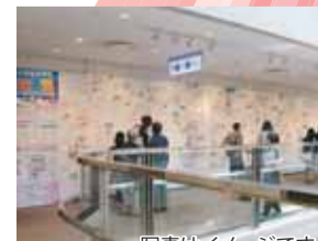
写真はイメージです。 ※一部、国際線旅客ターミナル4F 広小路にも展示しています

「未来の空港」をテーマに、大田区立の小学校に通う小学生が描いた作品を展示しています。子ども達の創造力豊かな作品をご覧ください。