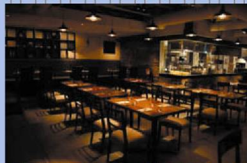
米国歴代3大統領就任晩餐会 総料理長、山本秀正シェフ が手がける羽田空港 展望デッキのカジュアルイタリアン PASTA & PIZZA CASTELMOLA(カステルモーラ)