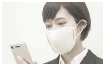
マスク着用のイメージ

日本空港ビルディング株式会社とドーナッツロボティクス株式会社は、羽田空港における実証実験を通じてドーナッツ社が開発した「多言語翻訳スマートマスク『C-FACE』」の店頭での展示および店頭とオンラインサイトにおける先行予約受付を開始します。