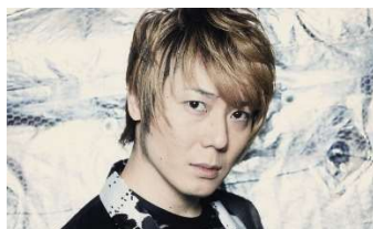
演出・構成 植木豪