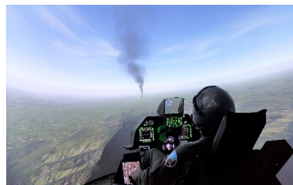
戦闘機ファイター体験