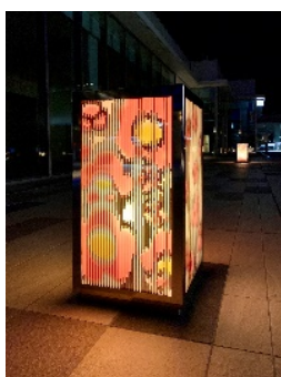
四季折々の音を奏でる花燈籠