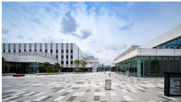
イノベーションコリダーからみる建物群

HiCity の各建物を結ぶイノベーションコリダーは、日本庭園の配植をベースにした植栽や、花札の絵柄に現代モダンアートの要素を加え、さらに日本の四季折々の音を奏でる「花燈籠」が施されており、訪れる人を迎え入れます。また、施設の屋上には、足湯スカイデッキが整備され、羽田空港を望む絶景を楽しむことができます。季節による植栽の変化や、イベントなどの開催に合わせたライティングや音の変化によって、HiCity を訪れた方々に向けて、日本の四季や文化の美しさを提供します。