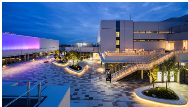
イノベーションコリダー(夜景)