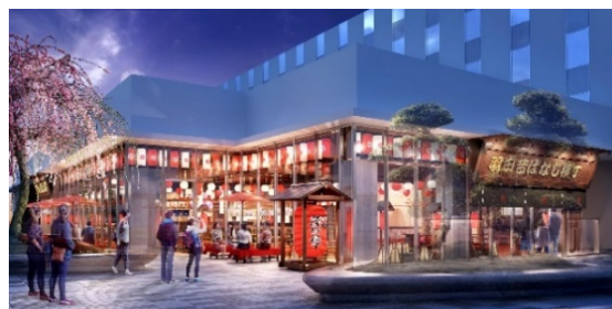
日本食体験レストラン

海外の観光客へ日本食や日本の食文化を発信することはもちろん、日本人にとっても日本食の魅力を再発見できるよう各分野において本物の「ルーツ」を持つ名店とコラボすると同時に、昔ばなしの世界に入り込んだような空間づくりにこだわり、日本の文化を五感で楽しめる空間です。