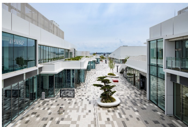
イノベーションコリダー