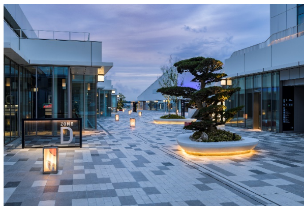
日本庭園の配植をベースにした植栽