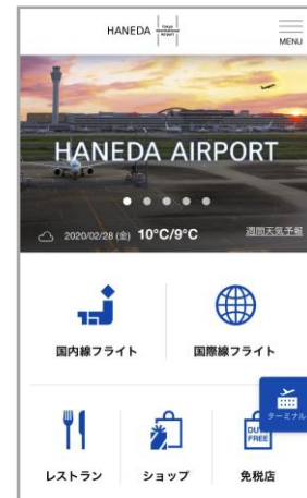
スマートフォン画面

■新 WEB サイト URL・・・ https://tokyo-haneda.com/