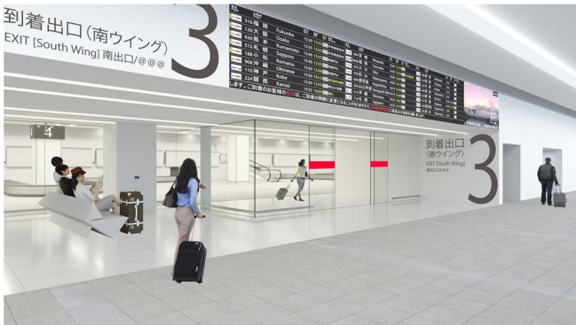
1階 到着ロビー(イメージ)