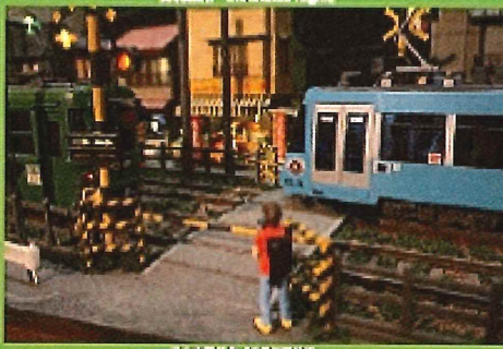
北原ラチオ店「電車」