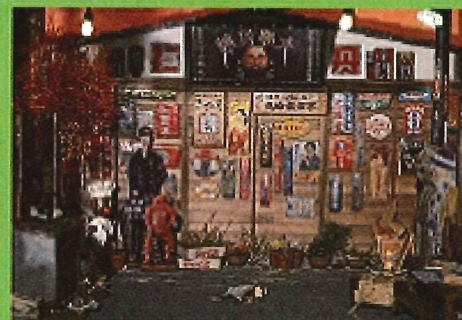
北原ラチオ店「北原ラチオ」展示風景