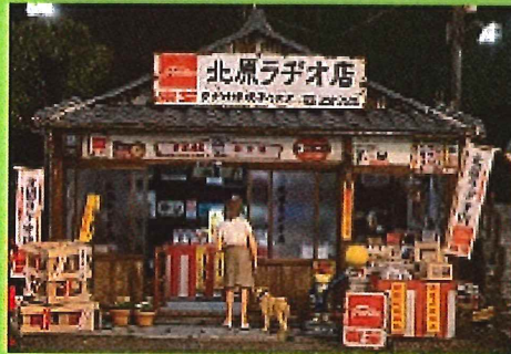
北原ラチオ店「イチイムトリアー」展示風景写真1