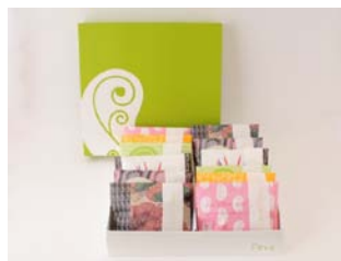
フェーブ Fève (羽田空港初出店)

コンセプトは『豆×スイーツ=Fève（しあわせ）』 パティシエ辻口博啓が手がける新しい感覚の豆スイーツ。 見た目にもこだわり、素材の栄養はそのままに、 バラエティーに富んだ20種類の豆スイーツをはじめ、豆乳 を使用したかりんとうや焼き菓子をご用意。持ち運びに便利 でコンパクトなパッケージで、いつでもどこでも新鮮な味を 楽しんで頂けます。普段使いから、ギフトまで様々なシーン に喜んでいただけるようなアイテムをご用意いたして おります。