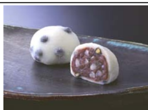
あかのえいせんそうほんけ 岡埜栄泉総本家 (羽田空港初出店)

デンマーク王室シェフチームのデザートシェフを務める モーテン・ハイバークが1999年に設立したスイーツ ブランド。「スイーツを通して、まるでサーカスのよう に楽しく幸せな時間をお届けしたい」というハイバーク の想いから命名しました。「Keep it simple（いつも シンプルでいこう）」をコンセプトに展開する、 スκανジナビアンスタイルのモダンスイーツです。