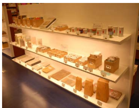
ショサイカン 南青山Shosaikanアネックス 【羽田空港ゲートラウンジ初出店】

体への安心、安全を考えた材料で作った揚げまんじゅう。 薄いアメのような皮のカリッとした食感と、生地 of サクサク 感が特徴です。時間とともに皮とあんこが油となじみ、 ふんわりとした饅頭になり、素材のうまみ、深みを感じて いただけます。名物の揚萬念（あげまんねん）（6個/ 税込504円）の他、季節商品もご用意しております。