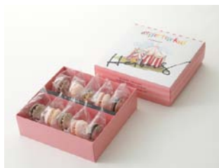
デザートサーカス (羽田空港初出店)

コンセプトは『豆×スイーツ=Fève（しあわせ）』 パティシエ辻口博啓が手がける新しい感覚の豆スイーツ。 見た目にもこだわり、素材の栄養はそのままに、 バラエティーに富んだ20種類の豆スイーツをはじめ、豆乳 を使用したかりんとうや焼き菓子をご用意。持ち運びに便利 でコンパクトなパッケージで、いつでもどこでも新鮮な味を 楽しんで頂けます。普段使いから、ギフトまで様々なシーン に喜んでいただけるようなアイテムをご用意いたして おります。