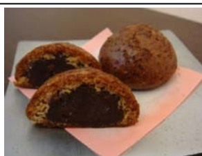
きちじょうじ 吉祥寺あまの (羽田空港初出店)

慶応、明治初期に浅草の駒形「岡埜栄泉」から親戚筋の 五軒に暖簾分けされたうちの一軒、東京・上野の「岡埜 栄泉総本家」が羽田空港初出店。数種類の大福や最中な どの定番商品をはじめ、様々な生菓子・焼き菓子をご提 供いたします。名物の豆大福（1個/税込200円）は、 厳選された最高級 of 材料を使用した、絹のように滑らか な餅生地 of 程よい塩味と、餡の深くすっきりとした甘さ が絶妙な逸品。季節のご挨拶や土産にも最適です。