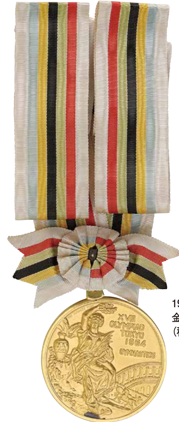
1964年東京オリンピック 金メダル (秩父宮記念スポーツ博物館蔵)