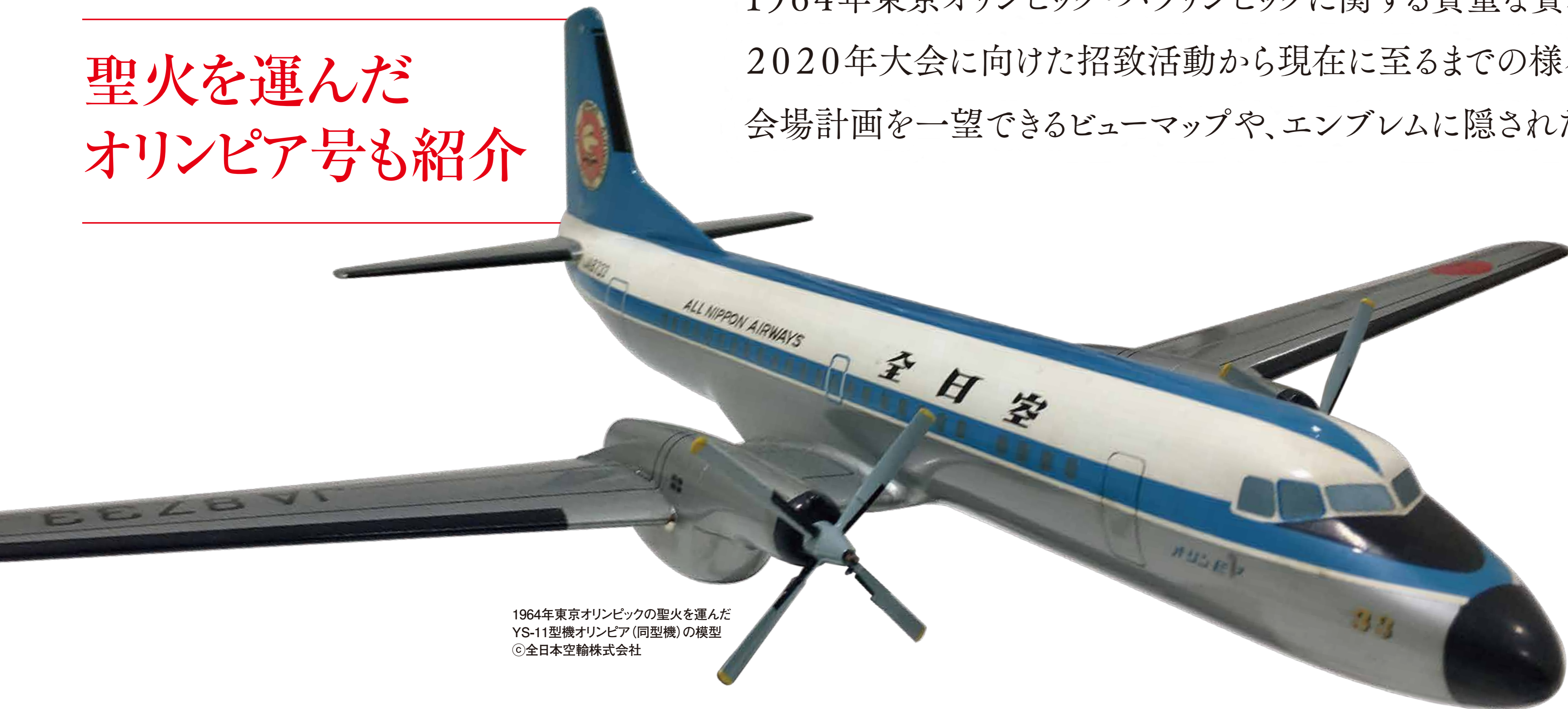
1964年東京オリンピックの聖火を運んだ YS-11型機オリンピア(同型機)の模型

1964年東京オリンピック・パラリンピックに関する貴重な資料と、 2020年大会に向けた招致活動から現在に至るまでの様々な取り組みを紹介します。 会場計画を一望できるビューマップや、エンブレムに隠された秘密を体験できるコーナーも!