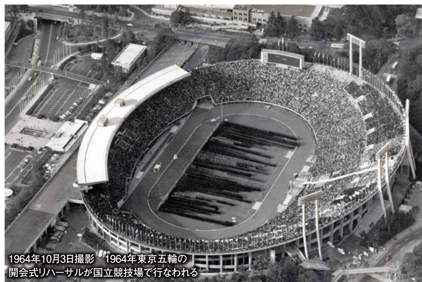
1964年10月3日撮影 1964年東京五輪の 開会式リハーサルが国立競技場で行なわれる