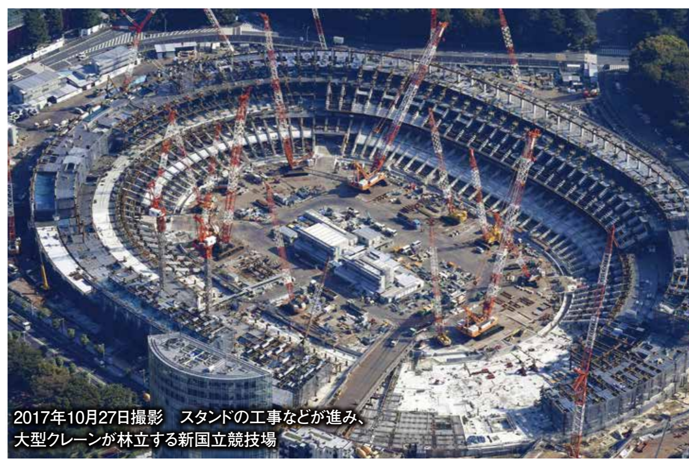
2017年10月27日撮影 スタンドの工事などが進む、 大型クレーンが林立する新国立競技場