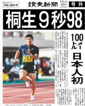
2017年9月9日読売新聞号外 アスリートの不断の努力を紹介