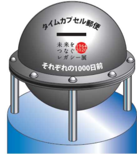
※イメージ 東京五輪開会式の日が届く タイムカプセル郵便

ディスカバリーミュージアムにおいて、第22回企画展「1964年から2020年東京オリンピック・パラリンピックへ 未来をつなぐレガシー展」第6期の「それぞれの1000日前」がスタートします。現代に伝わるオリンピック・パラリンピックがもたらしたさまざまなレガシー（遺産）をディスカバリーしてください。