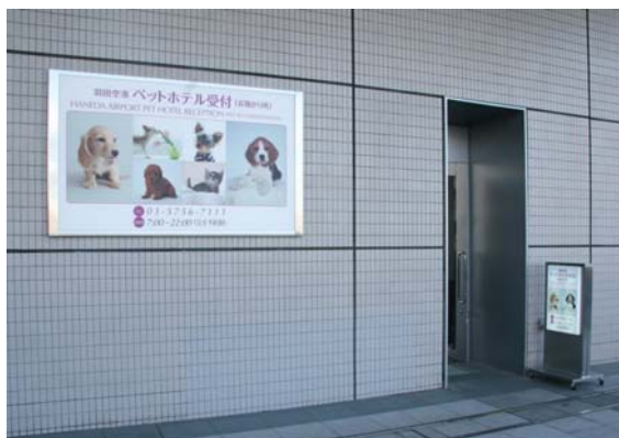
羽田空港ペットホテル受付（外観）