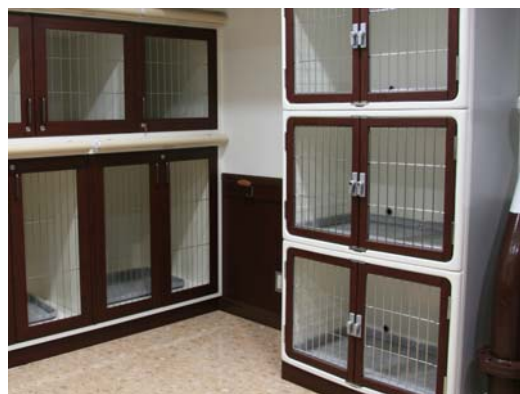
お預かり所内の様子