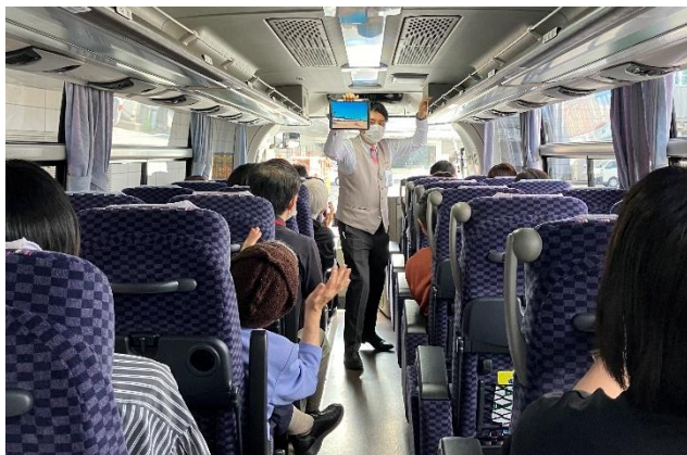
ツアーガイドによる、バスツアー中の様子

「羽田空港 制限区域内 見学バスツアー」は、保安検査を通過した乗客や職員など、限定された人しか入ることのできないエリアを専用のリムジンバスで周遊する特別な体験型ツアーです。羽田旅客サービスのスタッフによるツアーガイドは、まるでテーマパークに来たような盛り上がりで、皆さまガイドに合わせて体を左右に大きく動かしながら、飛行機の格納庫や管制塔、離陸待ちの飛行機を間近で見た時には大きな拍手と歓声が上がりました。また、そうした楽しさの中にも空港運営のサステナビリティや地域社会との関わりを皆様に体感していただきました。