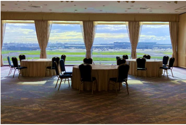
滑走路を一望できるギャラクシーホール