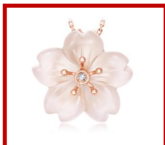
日本限定桜シリーズ