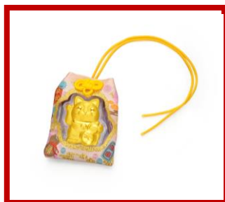
日本限定招き猫御守