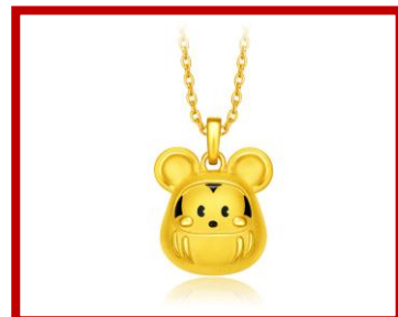
日本限定ディズニー シリーズ