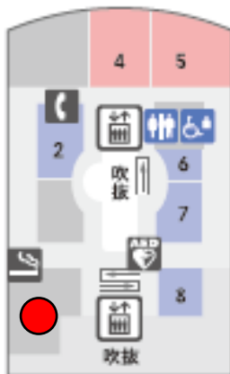
羽田空港 第1ターミナル 4階