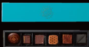
M.O.F. Selection Box

本イベントの開催を記念した、羽田空港限定オリジナルセレクションボックスを販売します。