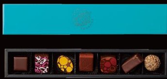
JAPAN Selection Box

フランスの人間国宝ともいわれる 「M.O.F.」の称号を持つ ショコラティエ 6 名のチョコレートを ひとつのボックスに。