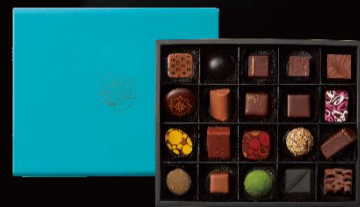
Chocolatier Selection Box

わが国を代表するパティシエ、 ショコラティエから“最高のひと粒”を 詰め合わせました。 日本人ならではの繊細な味わいをご賞 味ください。