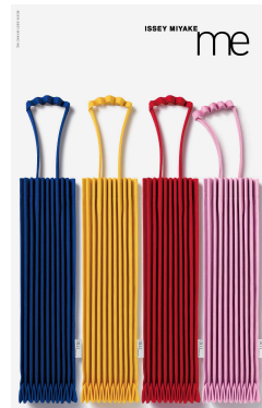
商品 (TRUNK PLEATS BAG)

日本空港ビルディング株式会社は2019年4月3日(水)、成田国際空港第2ターミナル本館4階ロビーエリアに「me ISSEY MIYAKE」をオープンします。同ブランドの空港出店は、常設店としては世界初となります。