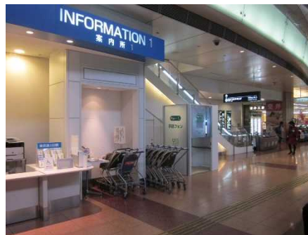
第2 旅客ターミナル 2階出発ロビー

羽田空港では、12月3日、国内初となる聴覚障害者向けの手話対応型公衆電話ボックス「手話フォン」を羽田空港国内線第1・2旅客ターミナル 出発ロビーに設置します。