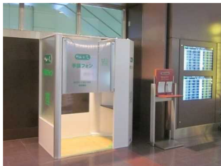
第1 旅客ターミナル 2階出発ロビー