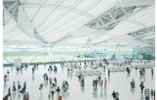
増築部 出発ロビー（イメージ）

日本空港ビルディング株式会社は、本年10月6日（予定）より、第2旅客ターミナルで国際線対応施設の整備工事に着手いたします。