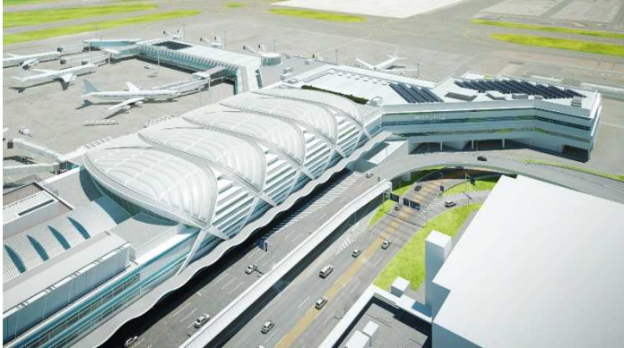
増築部 外観（イメージ）