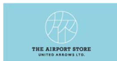
「旅」の文字をモチーフにしたストアロゴ