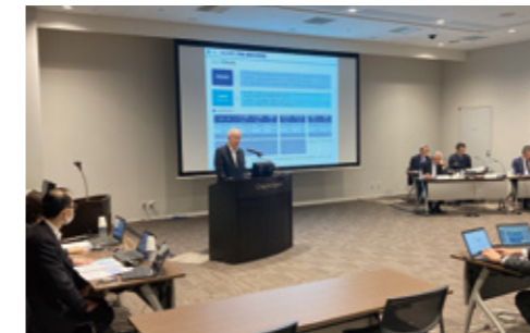
2023年3月期決算説明会の様子

年3月期の決算説明会については、実地開催とライブ配信のハイブリッド方式で実施し、機関投資家や証券会社のアナリストの皆さまにご参加いただきました。